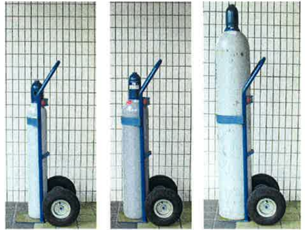
10リッター/1.5m 3 20リッター/3.0m 3 47リッター/7.0m 3